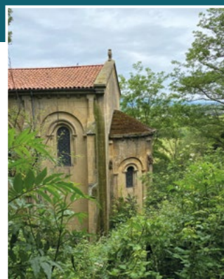
Vue de la chapelle de la Caoue depuis le sentier vert

Dans le cadre du budget participatif 2023, le projet retenu concernait l'aménagement de la rue de l'Avenir et les travaux débuteront en janvier 2025.