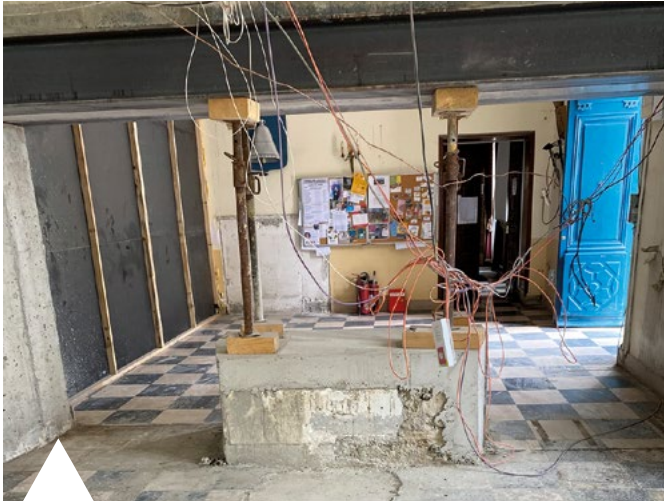
Les travaux de démolition du hall d'entrée ont commencé

À leur achèvement, un nouvel espace, plus convivial et fonctionnel, sera mis à disposition, offrant un cadre agréable tant pour le personnel que pour les usagers.